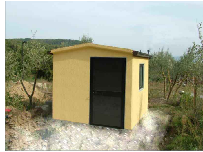
- Locale tecnico per impianti rete idrica - L255 x P260 x H235 cm