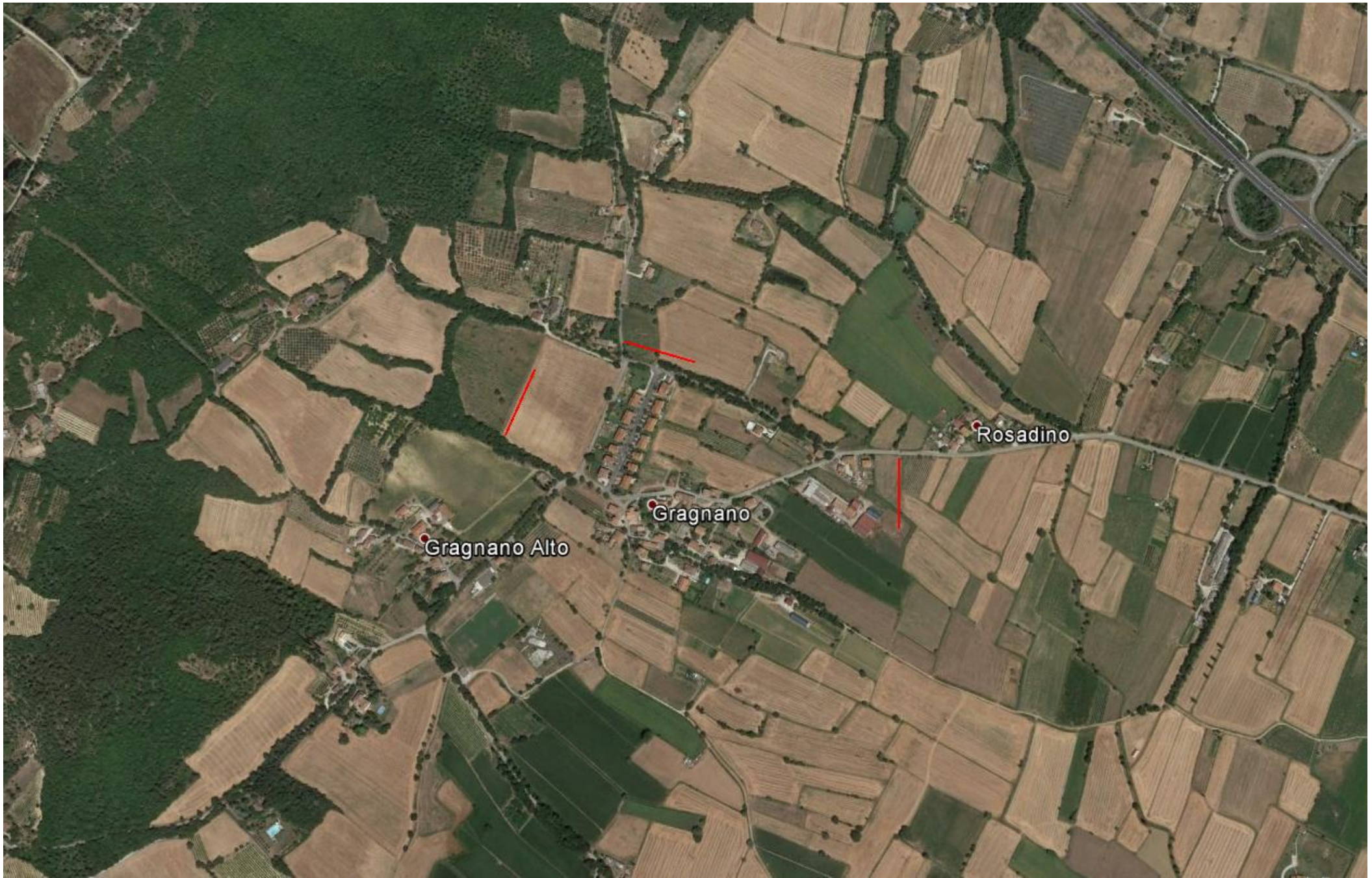
indagini (stendimenti in rosso) nell'abitato di Gragnano