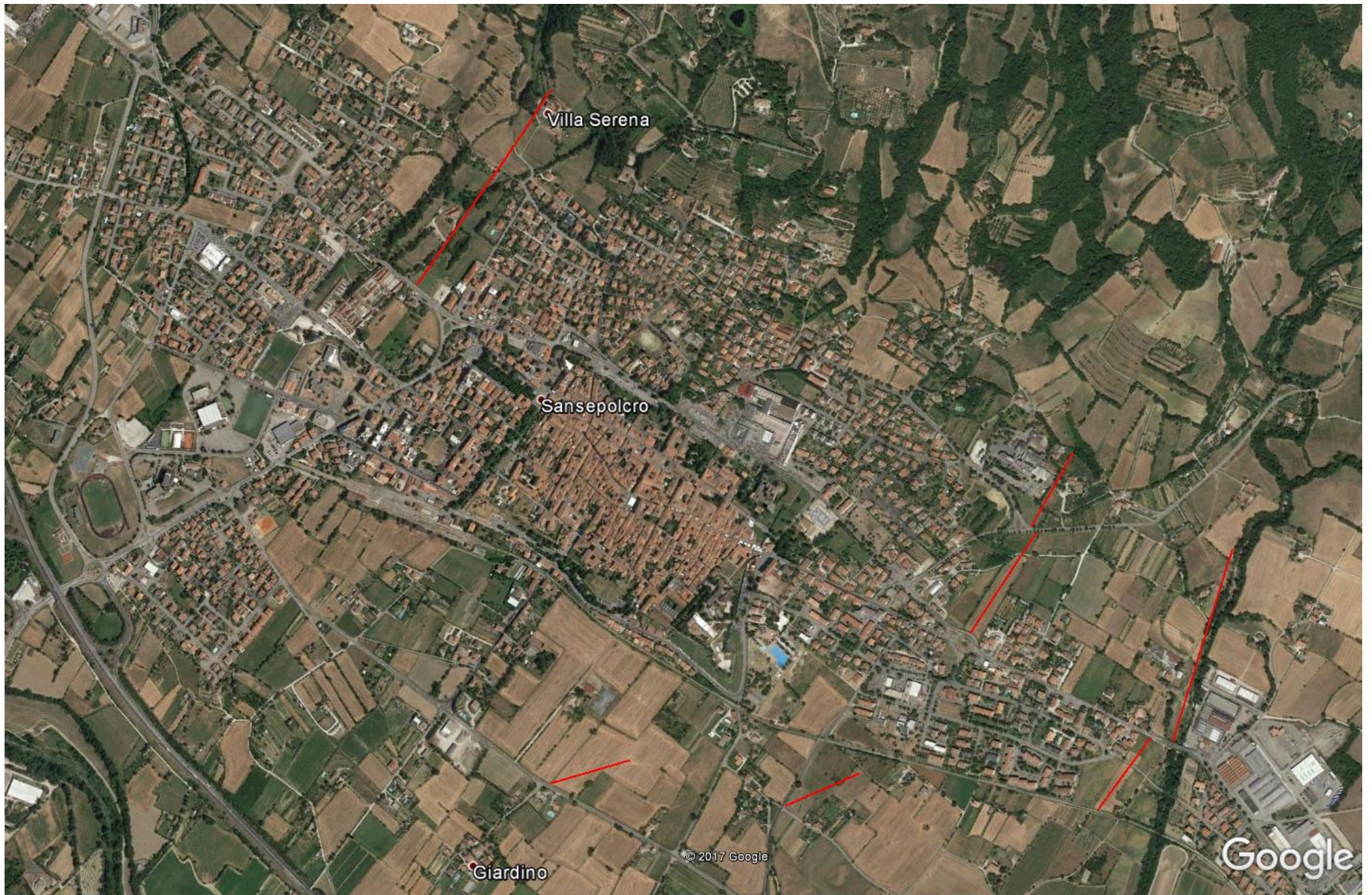
indagini (stendimenti in rosso) nell'abitato di Sansepolcro