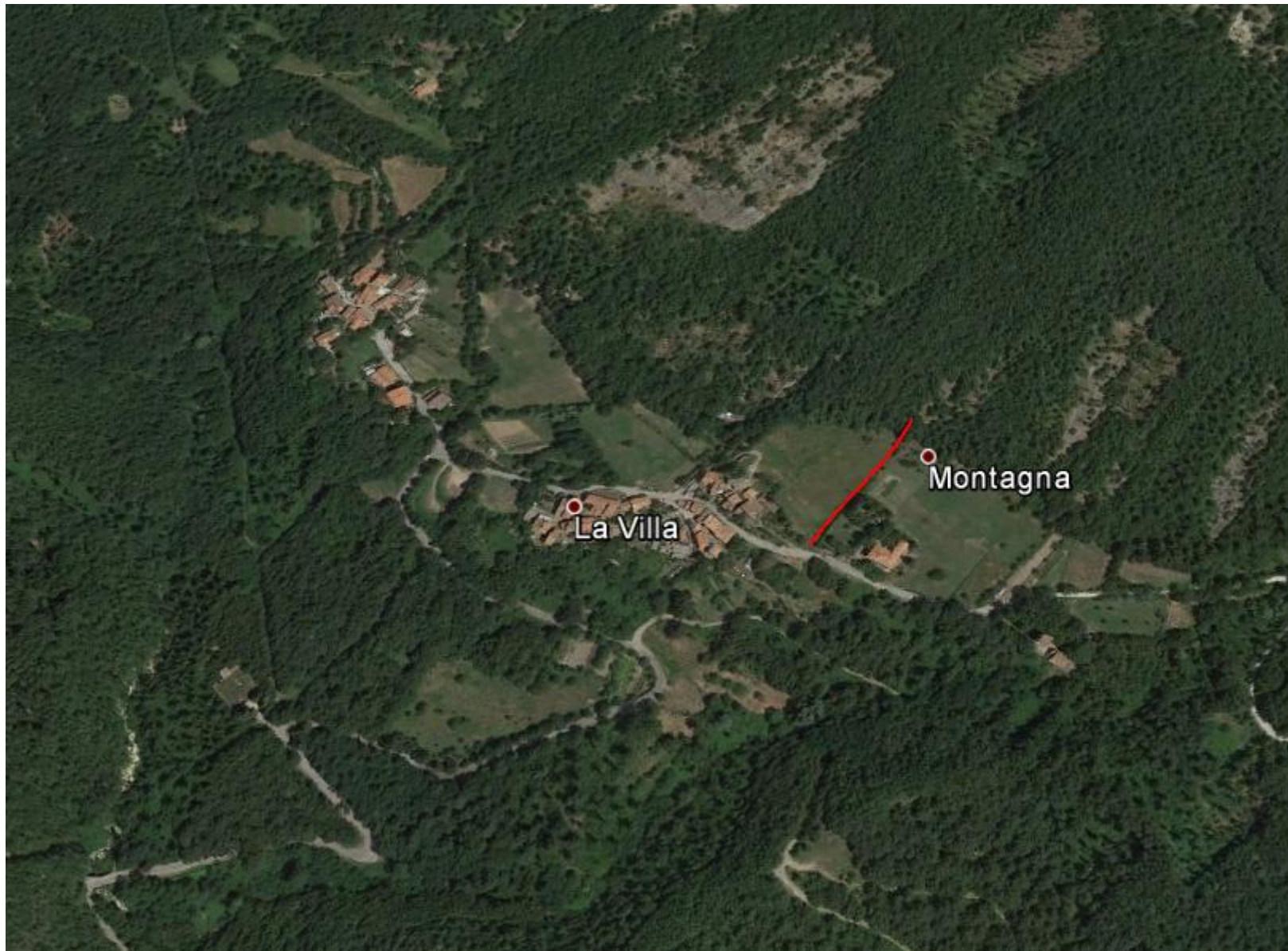
indagini (stendimenti in rosso) nell'abitato di Montagna