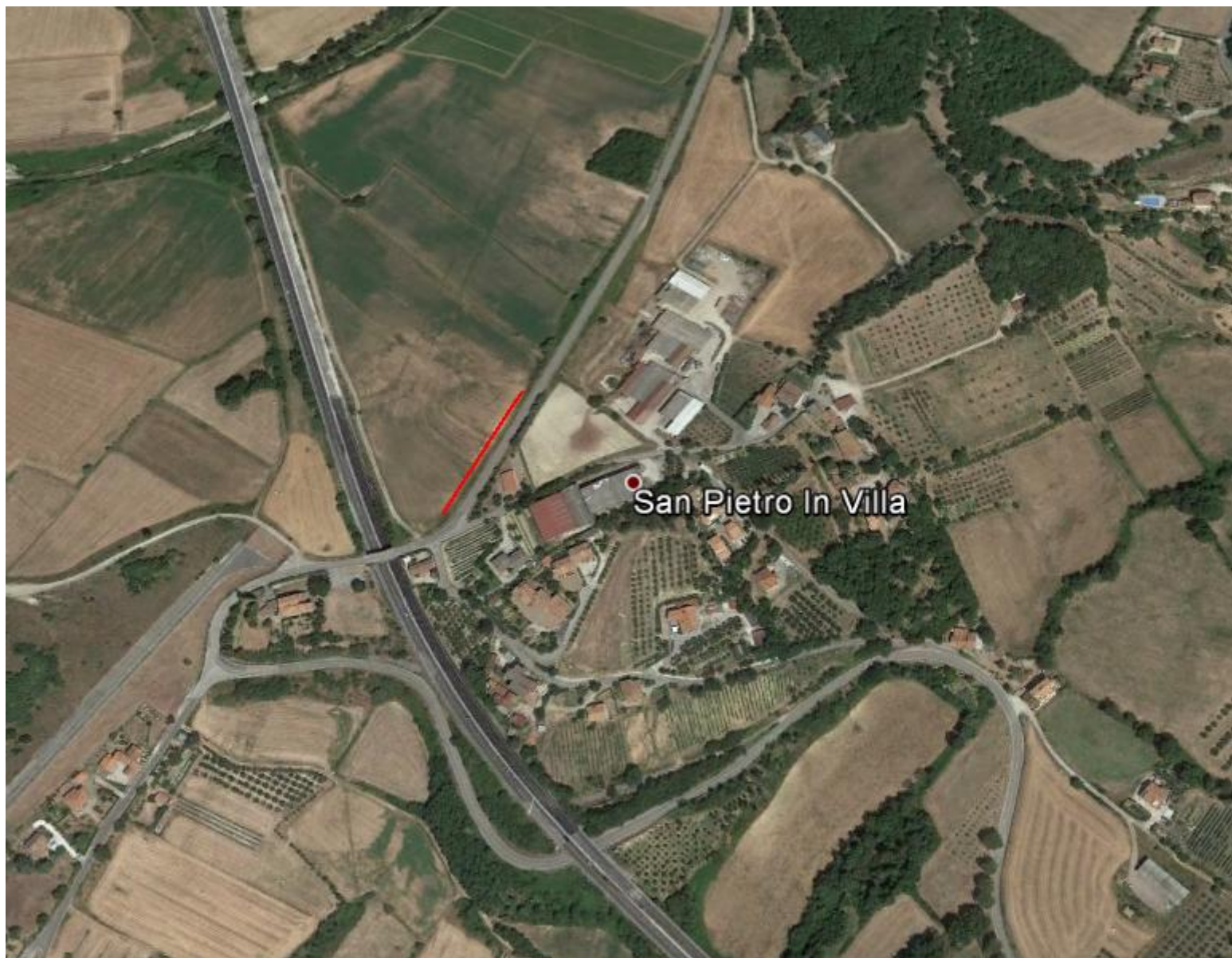
indagini (stendimenti in rosso) nell'abitato di San Pietro in Villa