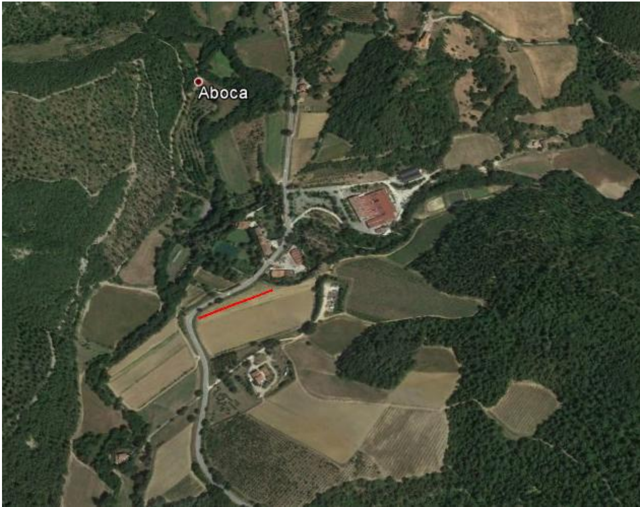
indagini (stendimenti in rosso) nell'abitato di Aboca