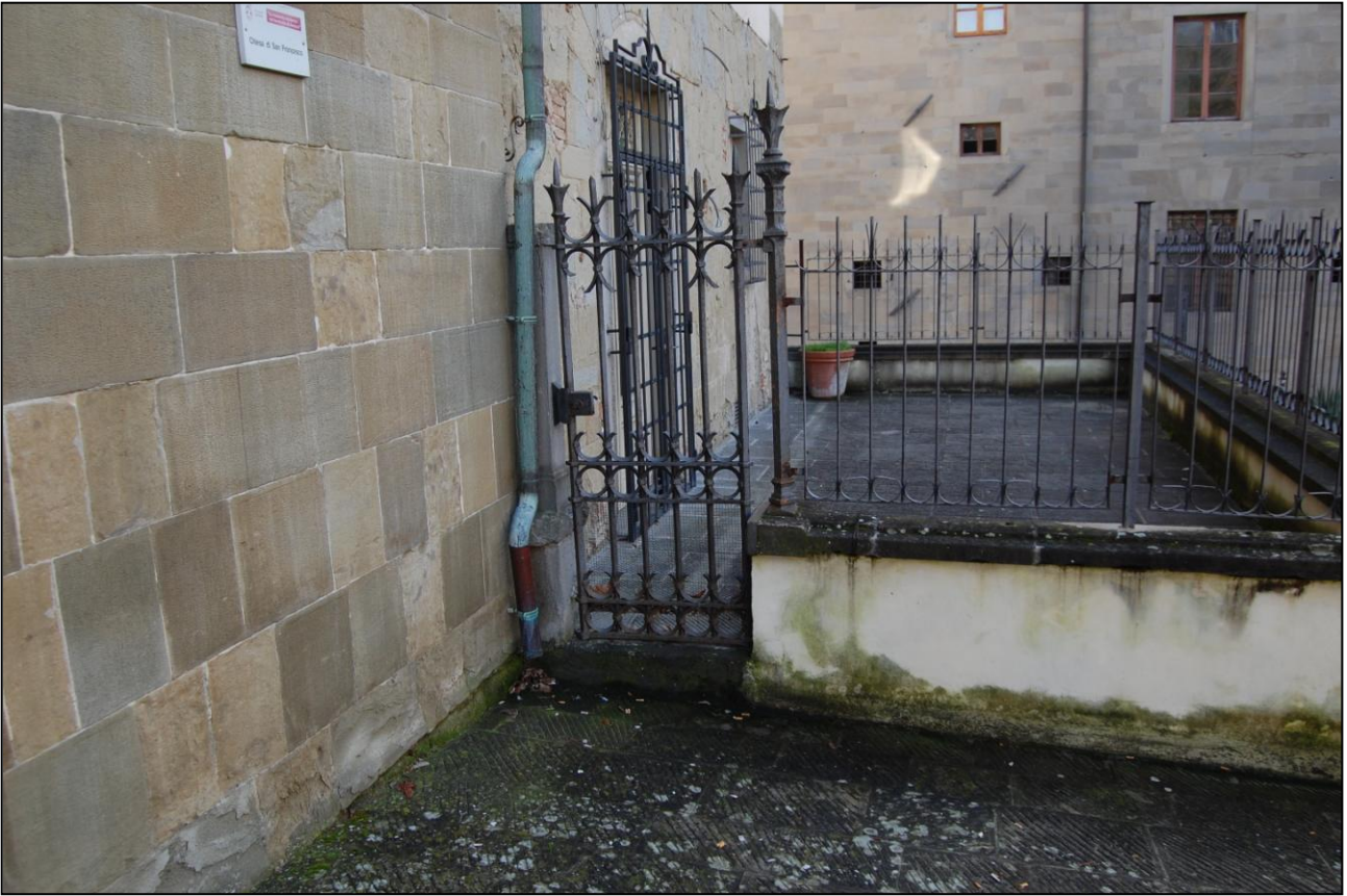
Ingressi dalla Pubblica Viabilità da piazza San Francesco Dove si evince la presenza di un gradino da superare in caso di Abbattimento delle Barriere Architettoniche